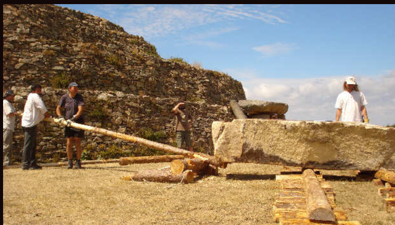
déplacement par translation alternée aux leviers