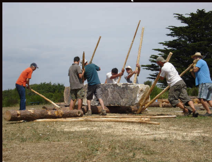
déplacement par roulage sur guindeaux

après 3 premières journées d'expérimentations riches en émotions et en données inédites sur la manutention et le transport des blocs mégalithiques, nous serions ravis de vous retrouver le mercredi 18 août pour ce qui s'annonce comme le point d'orgue de cette opération de médiation du patrimoine... un transport par avironnage... une première en France.