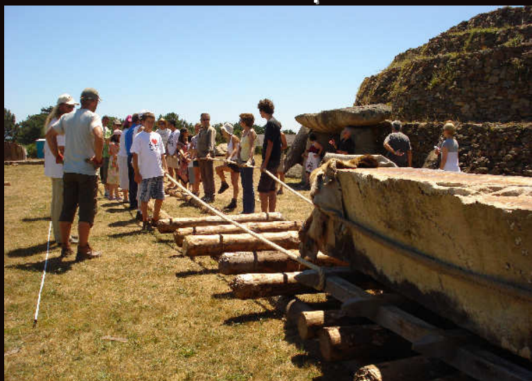
déplacement par différentes méthodes de tractions à la corde